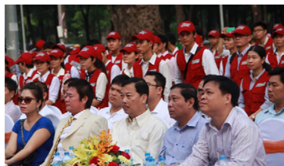
Toàn cảnh Lễ ra quân