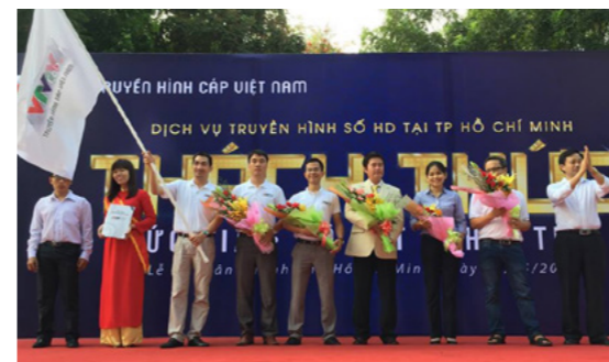
VTVcab phát lệnh ra quân và tặng hoa cho các đối tác hợp tác