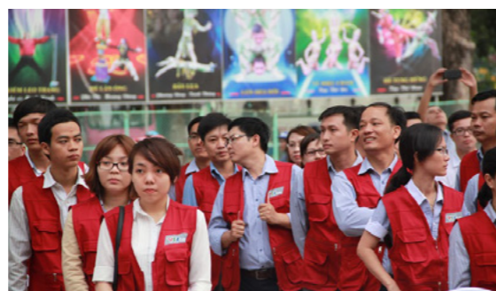
Đội ngũ SPT tại Lễ ra quân