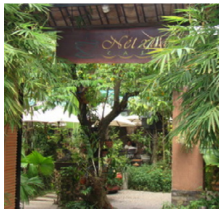
Cafe Nét Xưa - Q. Tân Phú