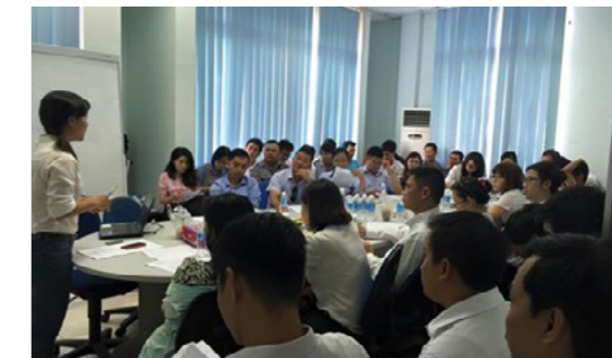
Đào tạo nội bộ về kiến thức sản phẩm, dịch vụ và kỹ năng bán hàng