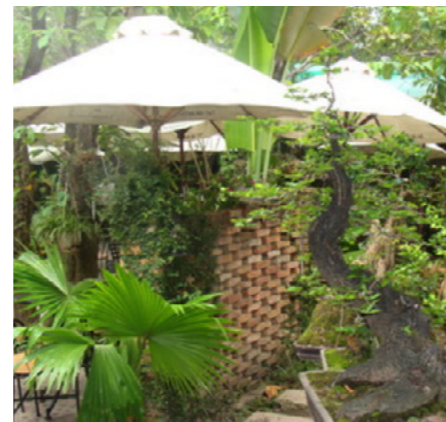
Một góc nhỏ của quán