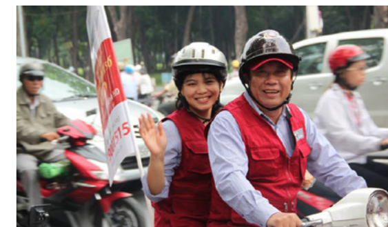
Chiến dịch thu hút sự tham gia của đông đảo CB-CNV SPT