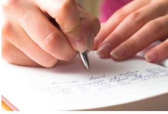
CÔNG ĐOÀN PHÁT ĐỘNG CUỘC THI VIẾT T.06