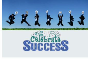
5 VIỆC LÀM HÀNG NGÀY CỦA DOANH NHÂN THÀNH CÔNG T.16