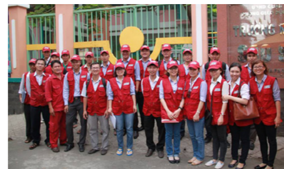
Chụp hình lưu niệm trước giờ xuất phát