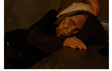
VIẾT CHO MẸ T.29